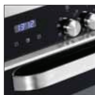
Programmatore elettronico Touch control