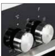
Manopola in metallo spazzolato