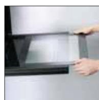
Vetro interno facilmente estraibile