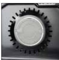
Funzione ventilata con filtro grassi