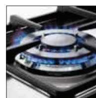
Brucciatore tripla corona e griglie in ghisa